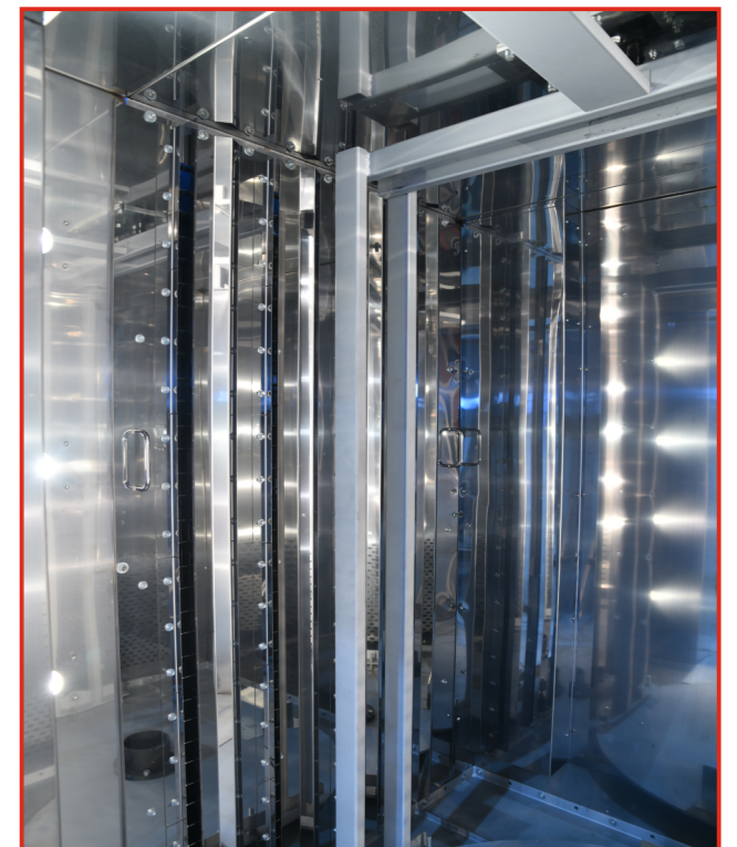
Пекарная камера ротационной печи «Муссон-ротатор» модель 250 МР Супер

- дверь пекарной камеры с двойным остеклением из термостойкого ударопрочного стекла. Внутреннее низкоэмиссионное стекло имеет высокие теплоотражающие свойства и позволяет снизить потери тепла. Уплотнение из силиконового резинового профиля исключает утечку паровоздушной смеси.