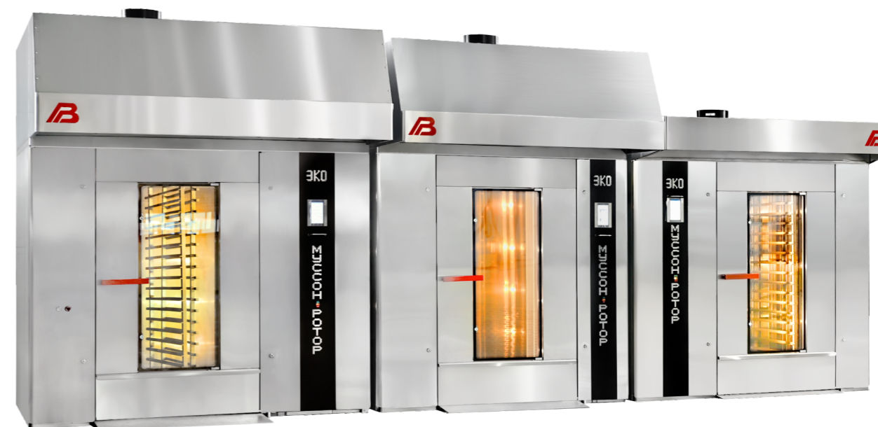
«Муссон-ротор» модель 350

Для повышения энергоэффективности и экологической безопасности печей при разработке был применен ряд инновационных решений, которые позволили приблизить КПД печей к теоретически достижимому максимуму. Внедрена инновационная трехходовая конструкция теплообменника с противотоком, где циркулирующий в печи поток воздуха движется от холодной зоны теплообменника к более горячей, максимально нагреваясь перед поступлением в пекарную камеру, оптимизирована схема движения отходящих газов. Это позволило уменьшить время разогрева