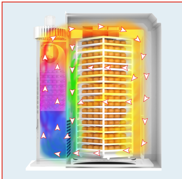
Схема движения воздуха в ротационной печи «Муссон-ротатор» модель 99/11-01

Система управления печами построена на базе микропроцессорного контроллера и цветной сенсорной панели оператора Touch-Screen. Применение пускорегулирующей аппаратуры отечественного и импортного производства обеспечивает минимальное техническое обслуживание, высокую надежность в эксплуатации, максимальный набор функций управления печью.