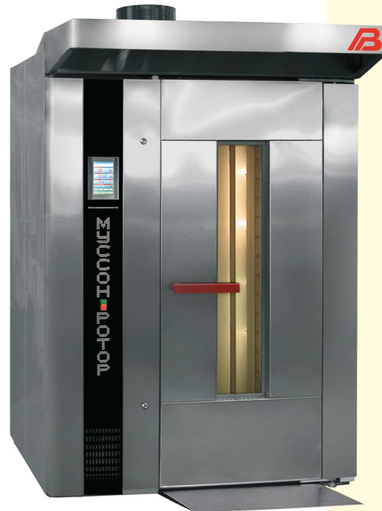
«Муссон-ротор» модель 55-01, 55-02, 55P-01, 55P-02

Multi-purpose rotary ovens (gas, liquid fuel, electric heating)