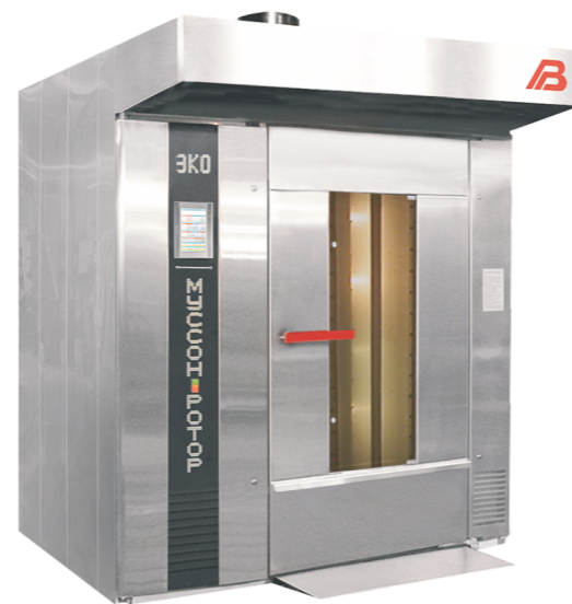
“Муссон ротор” модель 99/11-02