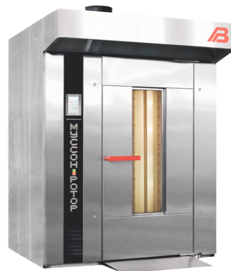
“Муссон ротор” модель 77М-01, 77М-02

- верхний привод вращения стеллажной тележки, передающий вращающий момент через рамку платформы, низкий порог пекарной камеры, короткий пандус, верхний узел фиксации тележки, запатентованный на территории РФ, упрощает закатывание тележки, позволяют избежать встряски тестовых заготовок при закатывании стеллажной тележки, исключают ее смещение во время выпечки