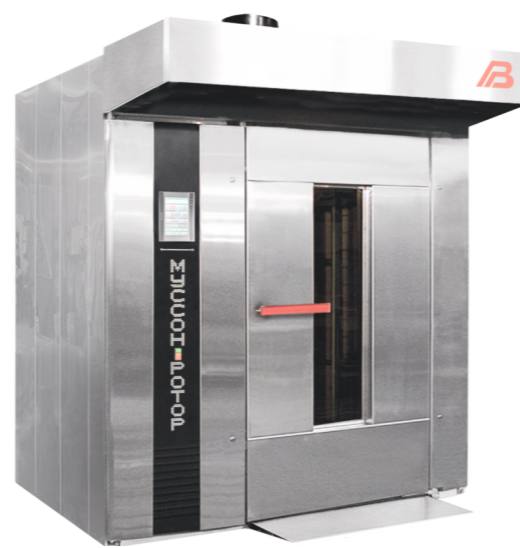
“Муссон ротор” модель 99М-01, 99М-02, 99MP-01, 99MP-02.