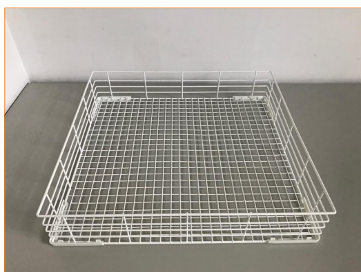
Универсальная кассета 901366 (570x620 мм)*