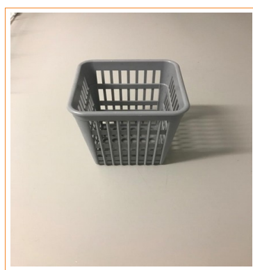
Вставка для столовых приборов 901621 *

Внешний вид кассет может отличаться в зависимости от партии товара. Кроме того, поставщик оставляет за собой право вносить изменения в комплектацию товара.