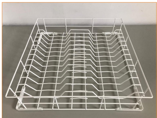
Кассета на 24 тарелки 901364 (570x620 мм)*

1 кассета на 24 тарелки, 1 универсальная кассета, 1 кассета для подносов, 1 вставка для столовых приборов.