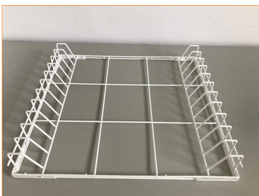
Кассета для подносов 901365 (570x620 мм)*